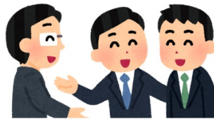
※ロースター記載順